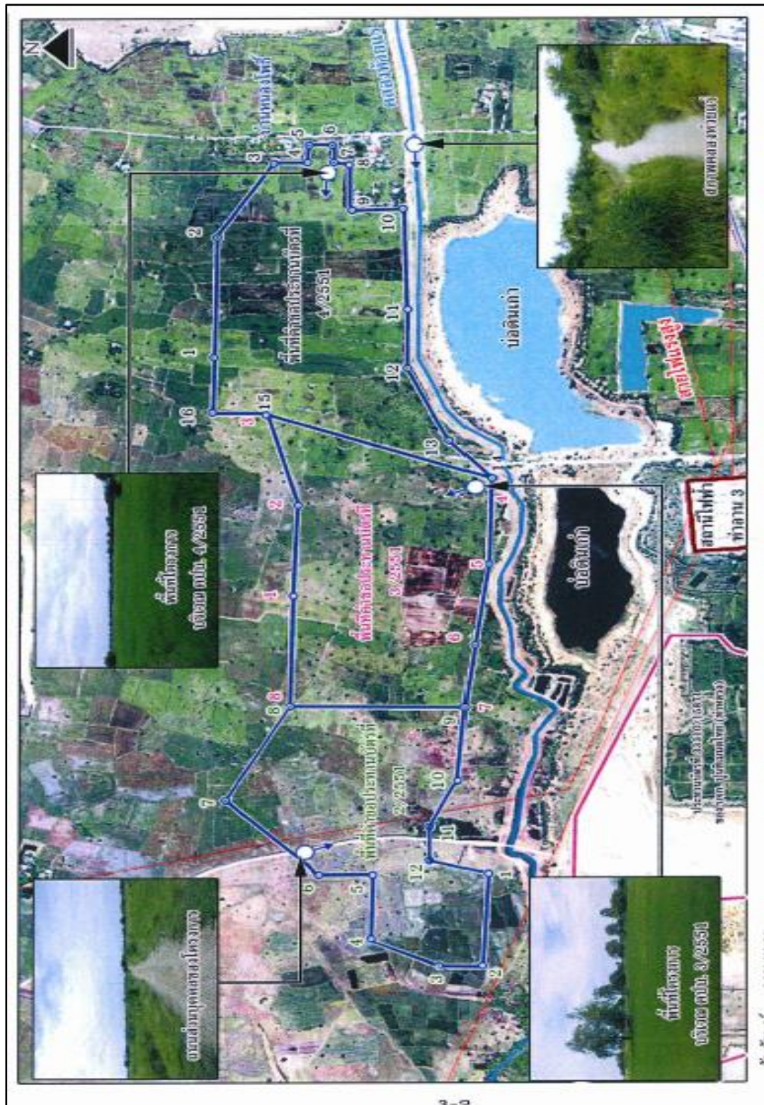
ภาพที่ 1.2 ลักษณะภูมิประเทศบริเวณโครงการ